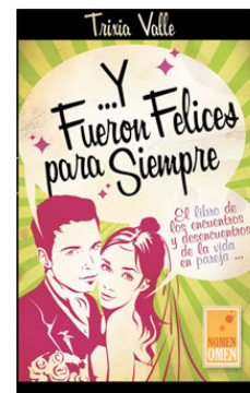
Noviazgo y Matrimonio