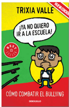
Bullying (Acoso escolar)