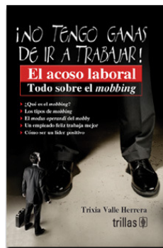
Mobbing (Acoso Laboral)